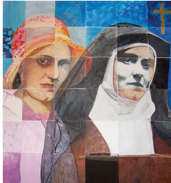
Bildnis Edith Stein gestaltet von Studierenden des Studiengangs Katholische Religion der KPH - Edith Stein

Durch die Forschungsgruppe wird ein angemessener Weg vorgestellt, die Spuren der Sicht- und Erfahrungsweise von SchülerInnen aufzuzeigen und für Entdeckungsprozesse fruchtbar zu machen.