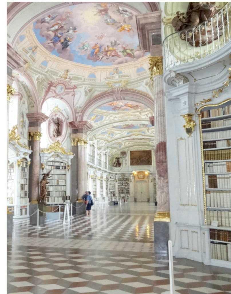
Weltgrößte Stiftsbibliothek Admont.

Religiöse Bildung vermittelt die befreiende Botschaft, dass christliches Leben zutiefst „erlöstes Dasein“ und „geschenktes Leben“ ist. Gerade in einer Leistungsgesellschaft, in der so vieles planbar und machbar ist, vermittelt sie das Geschenkhafte des Lebens. Dieser Aspekt kann wohl auch vor einer Überforderung schützen und zu einer Entlastung beitragen, wenn sich im Alltag eine große Differenz zwischen dem Anspruch religiöser Bildung und der konkreten Lebenswirklichkeit zeigt. Dann kann neu bewusst werden, dass es eine lebenslange Aufgabe ist und bleibt, Bildung und Glauben in einen ständigen Diskurs zu bringen und dabei immer wieder neue Horizonte zu eröffnen.